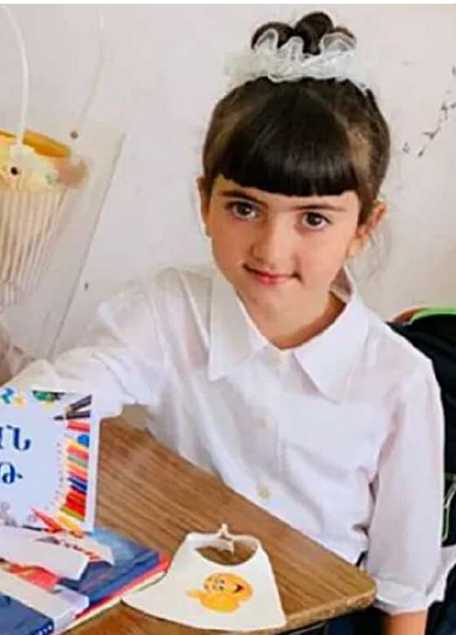
Nouvellement parrainée Gumri- Arménie 2021

La crise de la Covid, ainsi que les crises financières et sociales qui en ont découlé, ont fortement impacté l'éducation de vos jeunes filleuls. Les cours en ligne, les leçons à distance et l'utilisation des technologies informatiques n'ont pas été, facilement, à la portée de tous. Avec le soutien démesuré de nos coordinateurs locaux, des responsables des centres et des soeurs des différentes Congrégations dans les quatre pays d'intervention, les enfants ont redoublé d'efforts et d'engagements envers cette scolarité tant mise à l'épreuve. En ce début d'année 2021, malgré les circonstances, une vingtaine de nouveaux parrains ont rejoint cette aventure humaine.