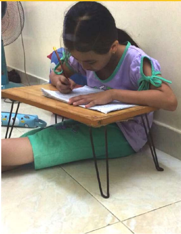
L'école à la maison Ho Chi Minh - Vietnam 2021

En mai dernier, les élèves et étudiants ont tous passé leurs examens finaux en présentiel. Les projets devraient réouvrir très prochainement pour que les enfants, des familles les plus vulnérables, jouissent de l'ensemble des activités éducatives proposées, ainsi de tout ce qui est essentiel pour combler leurs besoins primaires.