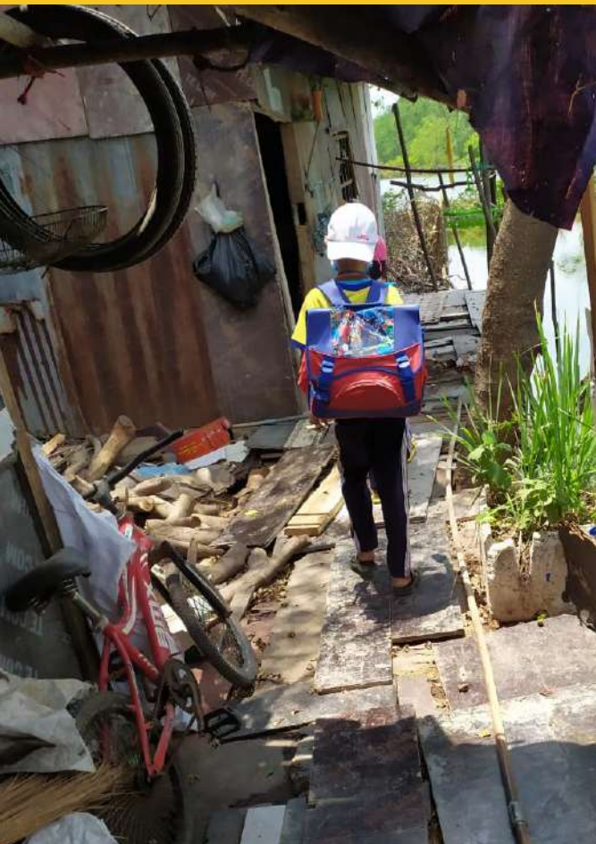
Sur les chemins de l'école Ho Chi Minh - Vietnam 2021