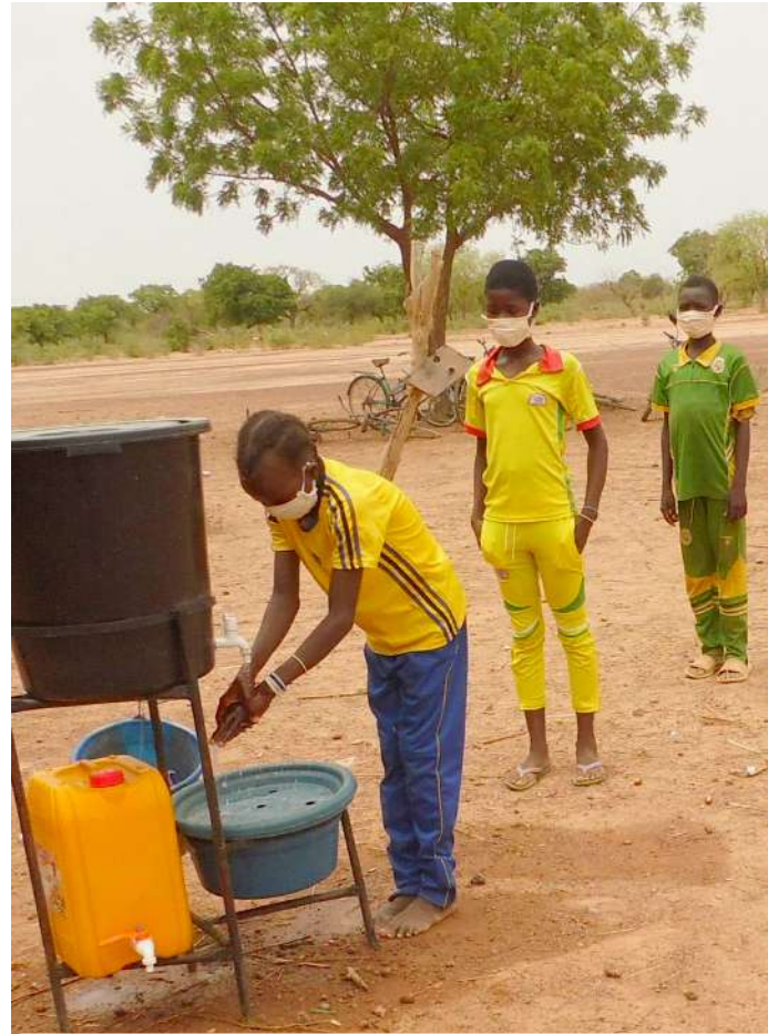
Gestes barrières à l'école de Guié Burkina 2021

Le centre de Deir Al Ahmar a ouvert de nouveau ses portes dès que possible pour permettre aux enfants et jeunes de suivre les cours en ligne. Au centre de Roueisset, dans ce quartier vulnérable de Beyrouth, une aide psychologique a aussi été proposée aux familles et aux enfants, pour qui le confinement et la crise économique ont fait baisser les bras. L'ouverture des écoles pour la rentrée scolaire de septembre est envisagée et redonnera un souffle d'espoir à la population libanaise.