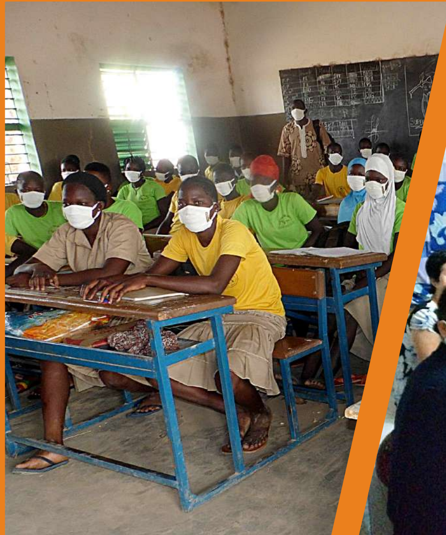
Etudiants du Lycée de Guié Burkina Faso