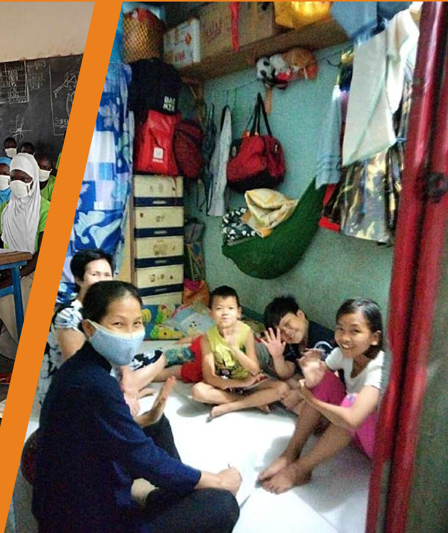
Home Visit des élèves de Cho Quan Vietnam

Comme la majorité des étudiants à travers le monde, les enfants parrainés au Burkina Faso et au Viêt Nam ont rajouté le masque à leurs fournitures scolaires.